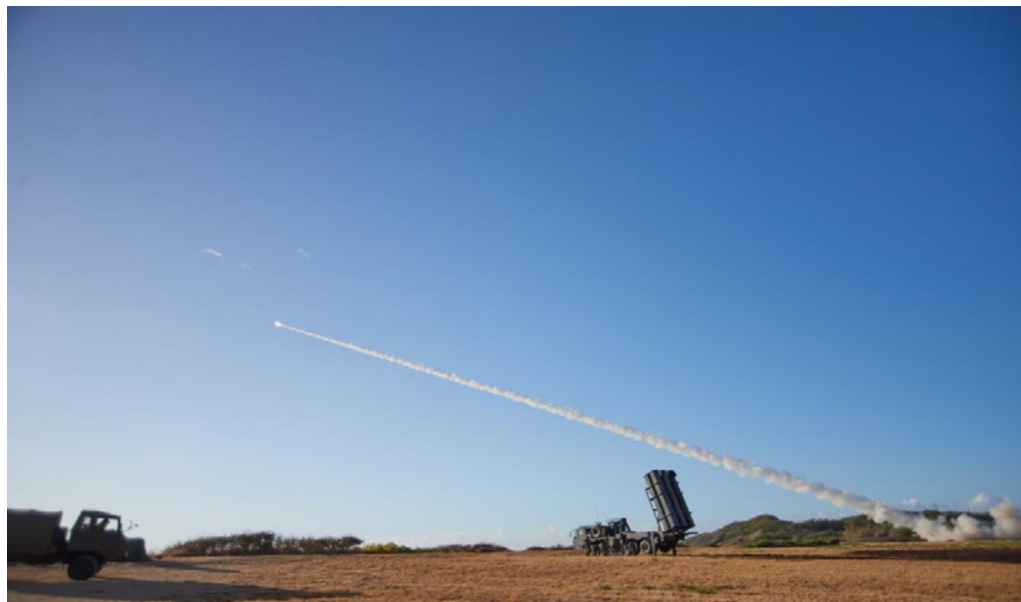
Figura N° 4: Sistema High Mobility Artillery Rocket System (HIMARS) del U.S Army y misiles Type 12 de las Fuerzas de Defensa de Japón en acción durante el Live Fire Exercise (LIVEX) en el Ejercicio RIMPAC 22 en la isla de Kauai.

La fase crítica del ejercicio para el U.S. Army lo constituye el “ Live Fire Exercise ” (LIVEX), el que está inserto en la fase FIT y que se desarrolló el día 22 de julio en el Pacific Missile Range Facility (PMRF) en la isla de Kauai. En dicha fase se realizó tiro real de misiles japoneses Type 12 Surface to Ship Missile (SSM), fuego de plataformas High Mobility Artillery Rocket System (HIMARS) y empleo de helicópteros de ataque AH-64 “Apache” del U.S Army. Asimismo, se emplearon efectos no-kinéticos, 14 mediante el accionar de medios de guerra electrónica y ciberoperaciones. El objetivo fue un buque dado de baja de la U.S. Navy (USS Denver), el que se encontraba a 50 millas náuticas desde la costa de Kauai y que fue impactado exitosamente por los medios del U.S. Army y por las Fuerzas Terrestres de Autodefensa de Japón.