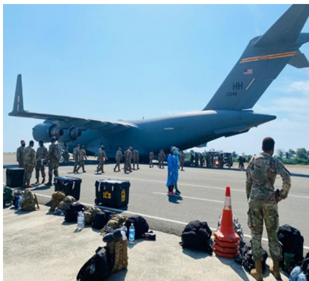
Figura N° 3: Tropas del 412 th Theater Engineer Command (TEC), arriban en una aeronave C-17 al Aeropuerto Nicolau Lobato en Dili, Timor Leste en julio de 2021.