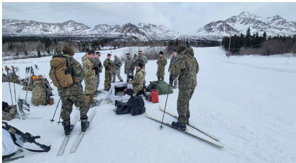
Figura N° 2: Especialistas en montaña del Ejército de Chile y soldados del “U.S Army Northern Warfare Training Center”, durante un ejercicio de entrenamiento en clima ártico en el Campo de Instrucción Black Rapids en Alaska.