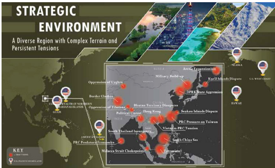
Figura N° 1: Área de Operaciones del Indo-Pacífico.

Por otro lado, durante la última década, se ha producido un resurgimiento de las fuerzas navales en el Indo-Pacífico encontrándose el 90% de la producción naval mundial en esta área del planeta, concentrándose el 85% de esta producción entre China, Japón y Corea del Sur. De hecho, China está produciendo un tonelaje militar similar a la totalidad de la Royal Navy en forma anual. 7